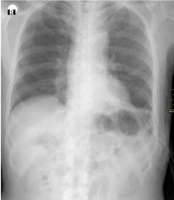
Şekil 2. Sol tüp torakostomi.

Nadir bir durum olan şilotoraks torasik kanalın tıkanmasına ya da bütünlüğünün bozulmasına bağlı olarak lenf sıvısının plevrada birikmesidir. Kardiyotorasik ameliyatlar sonrası %0.5-2 oranında görülen kalıcı şilotoraks yaşamı tehdit eden önemli bir komplikasyondur. [1] Erken tanı konup tedavi edilmediği takdirde yüksek bir morbidite ve mortalite ile seyrebilmektedir. İlk olarak 1633 yılında Bartolet tarafından tanımlanmış ve efüzyonun süt benzeri görünümü