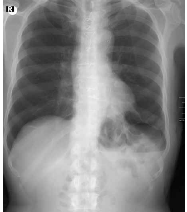
Şekil 3. Taburculuk sonrası kontrol akciğer grafisi.