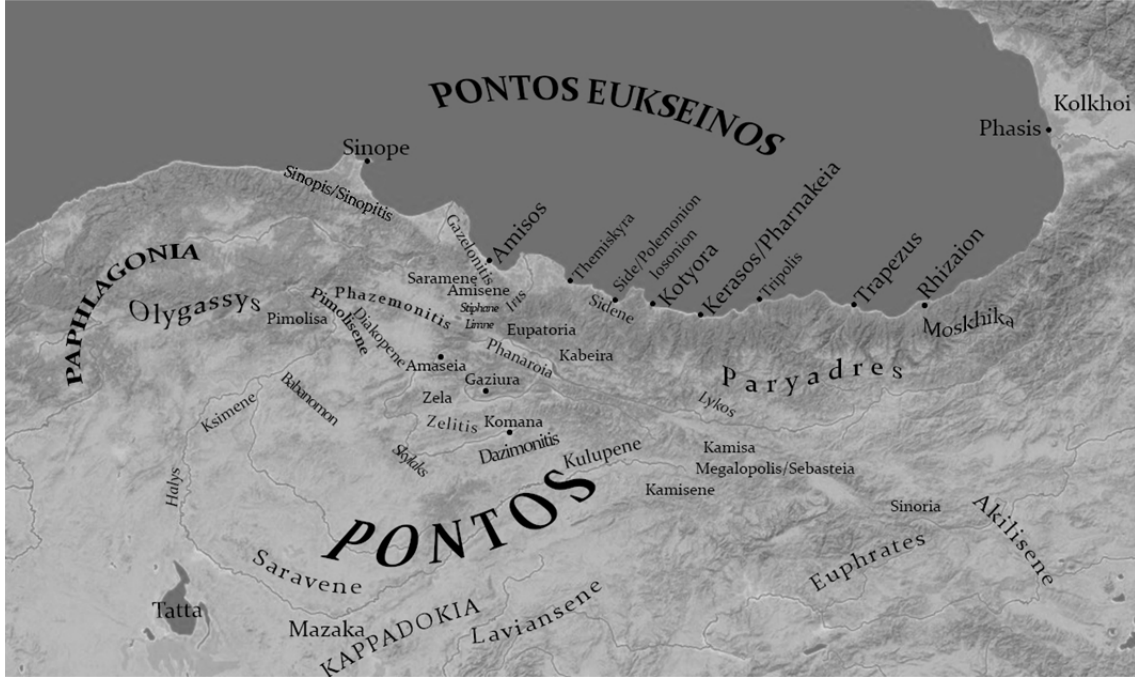
Fig. 1. Pontos Bölgesi

τὸν Εὐξένον = Euksenos çevresindeki Kappadokia 35 terimleri de kullanılmıştır.