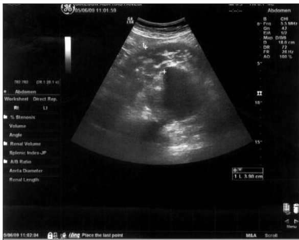
RESİM 1: Üriner sistem ultrasonografisi. Sol iliyak arter anevrizması ve çevresel hemorajik yumuşak doku artışı.

Bel ağrısı, karın ağrısı, idrar yaparken yanma şikayetleriyle acil servise gelen 63 yaşındaki hipertansiyon, dislipidemi ve geçirilmiş guatr operasyon öyküsü olan bayan hastada öncelikli olarak üriner sistemde taş ve idrar yolu enfeksiyonu düşünülmüş, istenilen üriner sistem ultrasonografik tetkikinde sol ana iliyak arterde 12x8,5x7,5 cm boyutlarında anevrizmatik dilatasyon ve 4 cm'ye ulaşan çevresel hemorajik yumuşak doku artışı görülmüştür (Resim 1). İliyak anevrizma rüptürü açısından pelvik BT yapılan hastada sol ana iliyak arterin hemen proksimal kesiminde en geniş yerinde 8,5 x 7,5 cm ölçülen sakküler anevrizmatik dilatasyon ve anevrizma rüptürü ile uyumlu geniş boyutlarda retroperitoneal hematoma izlenmiştir (Resim 2). Hasta, bilgisayarlı tomografi (BT) çekimi tamamlanırken kardiyopulmoner arrest gelişmesiyle kardiyopulmoner resusitasyon eşliğinde genel anestezi altında ameliyata alındı. Orta hat insizyonla batına girildi. Eksplozasyonda retroperitoneal bölgede yaygın hematoma beraber, anevrizmanın sol ana iliyak bifürkasyonun 1 cm kadar altından başladığı, sol iliyak interna ve eksterna ayrımından hemen önce sonlandığı ve posterior duvardan rüptüre olduğu, bununla bera-