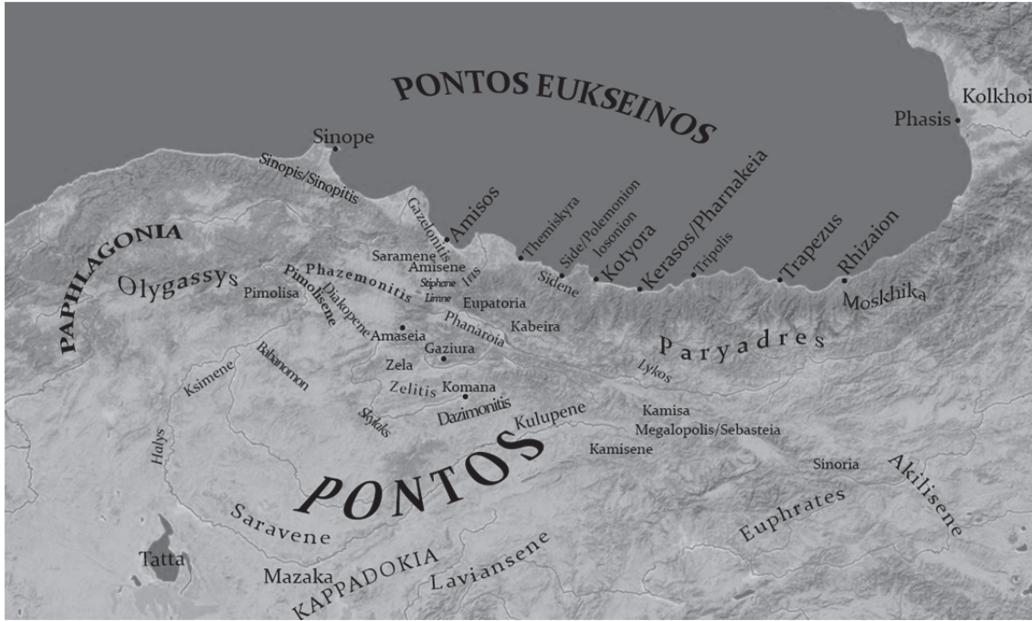
Fig. 1. Pontos Bölgesi

τὸν Εὐξένον = Euksenos çevresindeki Kappadokia 35 terimleri de kullanılmıştır.