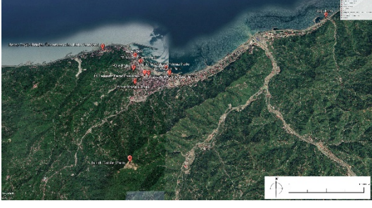
Şekil 1. Çalışma alanlarının konumu (Anonim, 2021)