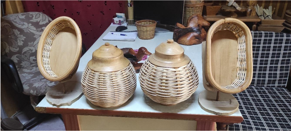
Fotoğraf 6: Őahin olak'ın Yöresel Sanatlara Yenilikçi Dokunuşlar Tasarım ve Üretim Atölyesi Projesi Kapsamında Yapmış Olduđu Ekmek Sepeti, Kuru Bakliyat Sepeti ve Fındık, Ceviz Sepeti