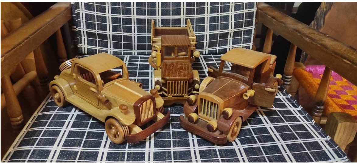
Fotoğraf 5: Őahin olak'a Ait Bazı AhŐap Arabalar (En sađdaki araba Atatürk'e ait aracın maketi)