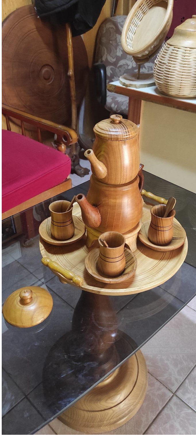
Fotoğraf 7: Çay Takımı (çaydanlık, çay bardağı, çay tabağı, çay kaşığı ve tepsi)